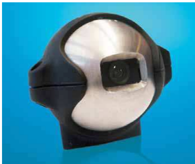
Bild 3: Kompaktkamera EC-710-090 in leichter Bauform (Gewicht 435g)

Bohrarbeiten eingesetzt. IP-Kameras oder Videoservert (Videoencoder) liefern die Bilder leicht zeitverzögert. In Abhängigkeit von der gewählten Auflösung und der Prozessorleistung kann die Verzögerung deutlich mehr als 100 ms betragen. Bei zeitkritischen Arbeiten, die über eine Kamera kontrolliert werden, finden deshalb meistens Analogkameras Anwendung. Hier wird das F-BAS-Signal der Kamera ohne Zeitverzug an einen Analogmonitor weitergeleitet. Eine Umwandlung des Bildsignals findet hierbei nicht statt. →