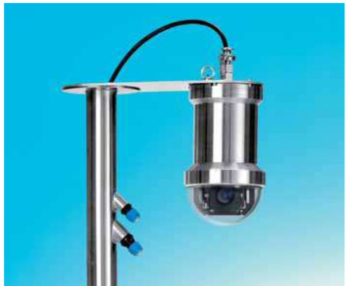
Bild 5: Edelstahl Domekamera EC-750, als IP- oder Analog-Version verfügbar