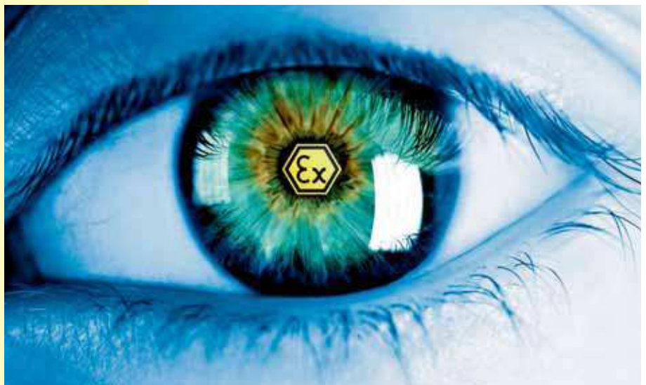
Bild 1: Die bildliche Überwachung von kritischen Industrieanlagen und die Prozessbeobachtung erhöhen die Sicherheit und verbessern Betriebsabläufe.

Heutzutage ist auf vielen Gebieten des öffentlichen Lebens die Videoüberwachung oder CCTV (Closed Circuit Television) alltäglich geworden. An öffentlichen Gebäuden und Bahnhöfen etc. findet man Überwachungskameras, die dem Schutz vor Straftaten und an Straßenkreuzungen der Unfallrekonstruktion dienen. Auch im industriellen Bereich wird diese Technik verstärkt eingesetzt, um Unfallschwerpunkte zu entschärfen oder Prozesse aus der Ferne zu beobachten. Dieser Wunsch nach mehr Sicherheit und zunehmender Prozessautomatisierung besteht natürlich auch im explosionsgefährdeten Bereich.