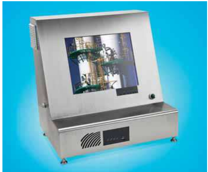
Bild 4: Steuereinheit des für ein Kamerasystems zur Unterstützung der Arbeiten an einer Bohranlage

Neben der benötigten Bandbreite ist auch die Aufzeichnungsdauer ein kritischer Punkt. Beispielsweise hat ein PAL-Bild im M-JPG-Format etwa 52 Kbyte. Bei einer Aufnahmedauer von 24 Stunden mit 25 fps ergibt sich so sehr schnell ein Datenvolumen von etwa 107 Gbyte pro Kamera. Größere Kameraanlagen stoßen damit